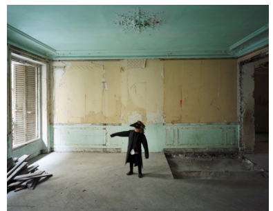
Série « Au Château », Le Fauteuil